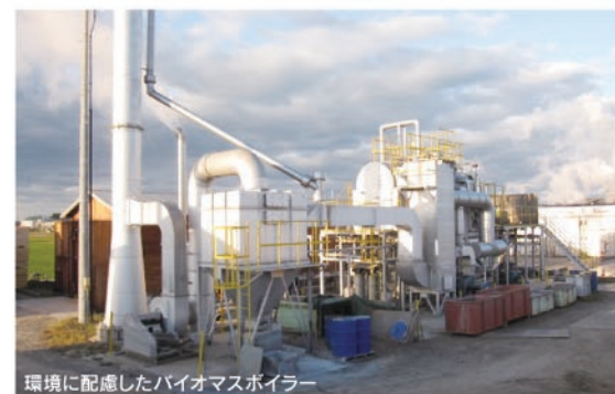
環境に配慮したバイオマスボイラー