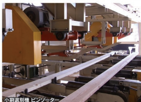
小割選別機 ビンソーター