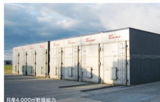
月産4,000m 3 乾燥能力